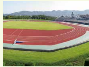
信夫ヶ丘総合運動公園 (陸上・野球場)

福島市スポーツ振興公社公式サイト ■お問い合わせ TEL:024-539-5500 https://www.sportspc.jp/