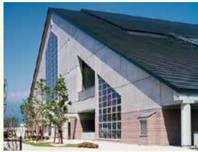
福島トヨタクラウンアリーナ (国体記念体育館)