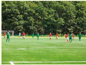
十六沼公園 (サッカー場・テニスコート・体育館)